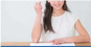
最高のスタートダッシュ!

中学校内容を予習しておくことで、その難しさを肌で感じ、心構えをすることができます。また、中学校の授業が復習となるため、理解度や定着度が格段に変わります。中学校内容を先行して学習することの意義はとて大きいです。