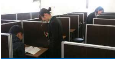
授業外も充実のフォロー!

中学校内容を予習しておくことで、その難しさを肌で感じ、心構えをすることができます。また、中学校の授業が復習となるため、理解度や定着度が格段に変わります。中学校内容を先行して学習することの意義はとて大きいです。