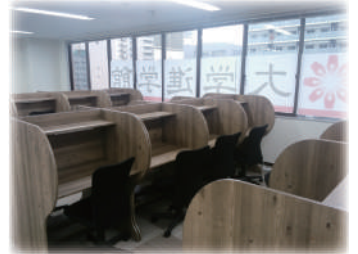
独立した自習スペースと 落ち着いた休憩スペース

高校生の声から生まれた学習環境です。大学情報や参考書を自由に活用できます。個別の自習ブースで周りを気にすることなく勉強に集中できます。また、パソコンも自由に利用できるから調べ物をするときに便利です。